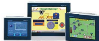
XBT OT 触摸屏