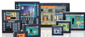
XBT GT/GK 触摸屏