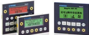
XBT N/R/RT 文本屏